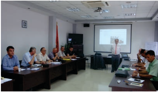
Gjatë zhvillimit të trajnimeve për vlerësues dëmsh në sigurime

Autoriteti i Mbikëqyrjes Financiare, nëpërmjet Qendrës së Edukimit organizoi në datat 1-3 qershor dhe 8-9 qershor trajnimin për kualifikim profesional për vlerësues dëmsh në sigurime dhe në datat 4-5 qershor dhe 10-12 qershor trajnimin për edukim në vazhdim për vlerësues dëmsh në sigurime.